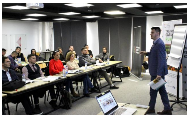
„Obuka koja garantuje zapošljavanje“ – od strane Kosovskog udruženja za maloprodaju