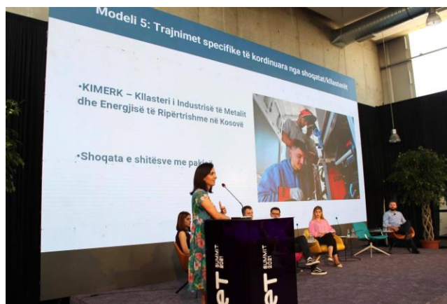
Projekti EYE mbështetë prirë SOO Samit në Kosovë