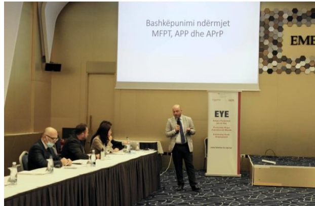
Radionica o unapređenju saradnje između javnih i privatnih agencija za zapošljavanje