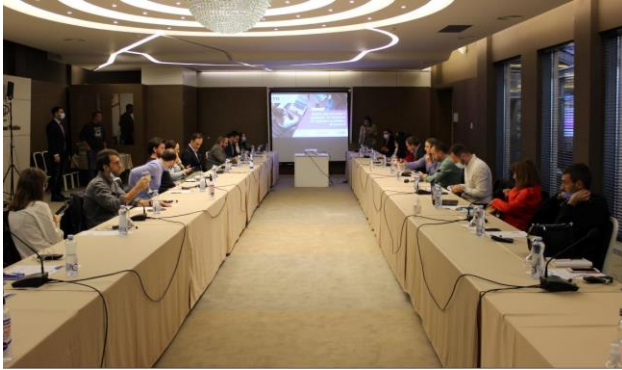
EYE predstavlja anketu za pružaoce neformalne obuke