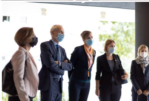
Shvajcarski diplomatski kor në vizitë EYE-ovim partnerimave