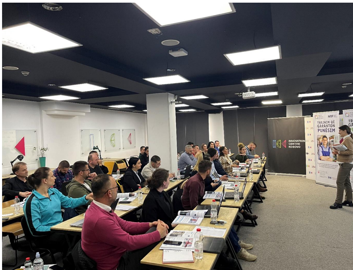
Obuka Kosovskog udruženja za maloprodaju o upravljanju maloprodajom