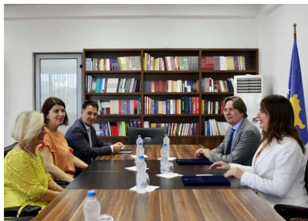
EYE dhe MONTI nënshkruajnë PS për SOO shkollave