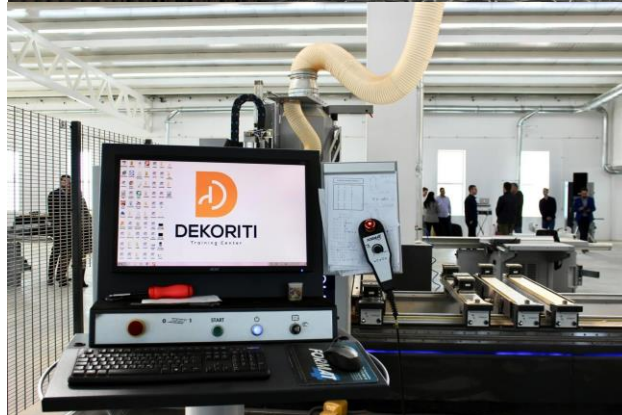
Dekoriti otvara vrata svog centra za obuku mladih koji su zainteresovani za preradu drveta