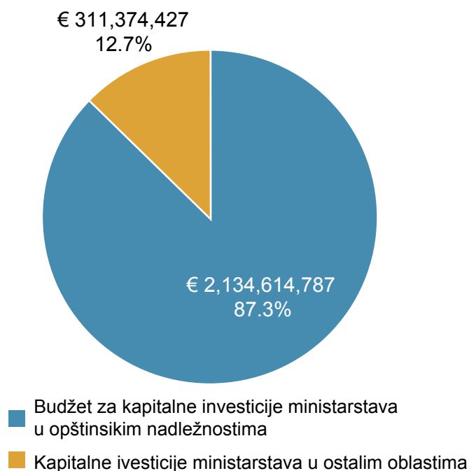
Grafikon 2. Kapitalne investicije od strane 12 resornih ministarstava u opštinske nadležnosti za period 2011 – 2017

U periodu od 2011. do 2017. godine, 12 resornih ministarstava potrošilo je 311 miliona evra ili 12,73% svog ukupnog kapitalnog budžeta za investicije u opštinske nadležnosti.