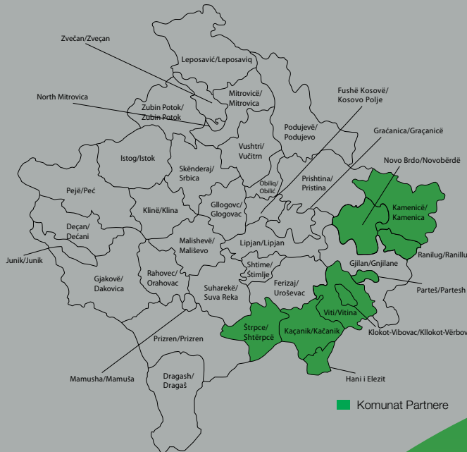
■ Komunat Partnere