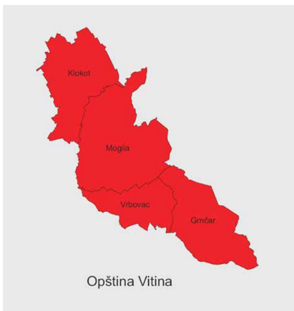
Slika 1. Katastarska podela opštine Klokot-Vrbovac

Ciljana zona za Lokalni plan upravljanja otpadom je cela administrativna zona opštine Klokot-Vrbovac. Na osnovu diskusija sa radnom grupom odlučeno je da se teritorija opštine podeli u dve zone što se tiče upravljanja otpadom i to na: Klokot i Vrbovac kao zona 1, dok su Mogila i Grnčar kao zona 2.